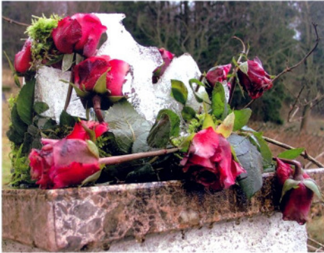
zweisprachige Anthologie bilingue ETAINA