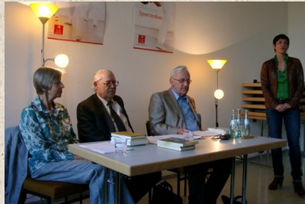
Begrüßung und Einführung