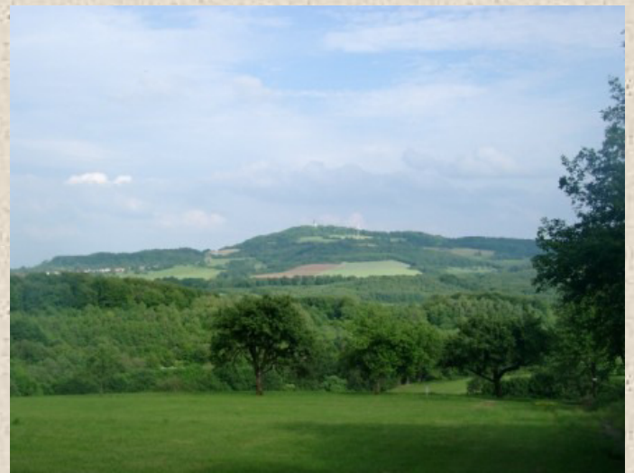
Der Schaumberg vom Johannes-Kühn-Weg in Hasborn aus gesehen