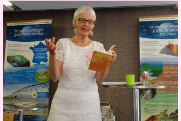
Gespräche nach der Lesung