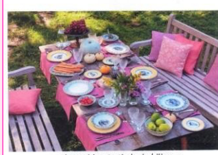
zweisprachige Anthologie bilingue ETAÏNA

Kulinarische Gedichte Poèmes de l'art culinaire