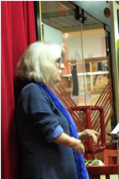
Die Lesung beginnt