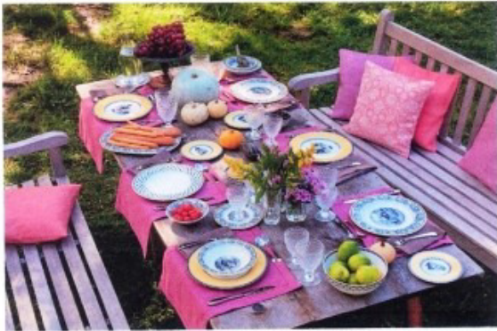
zweisprachige Anthologie bilingue ETAÏNA

Kulinarische Gedichte Poèmes de l'art culinaire